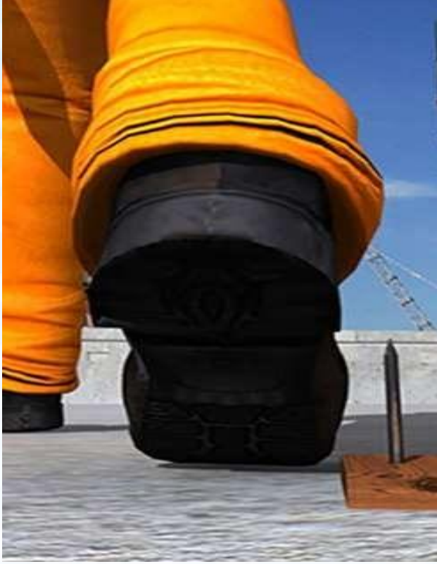
Ramak Kala Olay