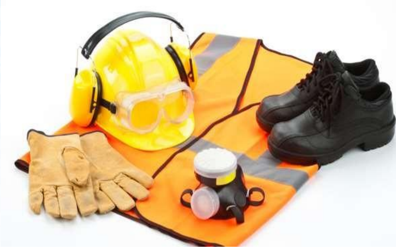
Kişisel Koruyucu Donanımlar (KKD)